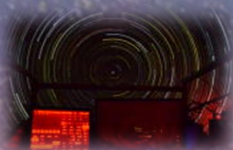
(デジタルプラネタリウム・ステラドームプロ)

旅の思い出に…ほんのひと時日常を離れ、満天の星に包まれる夜空の散歩に出かけましょう。