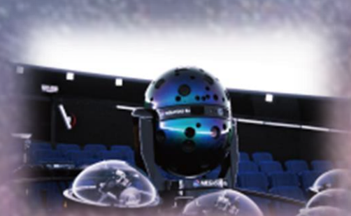
(光学式プラネタリウム・MEGASTAR-IIa)