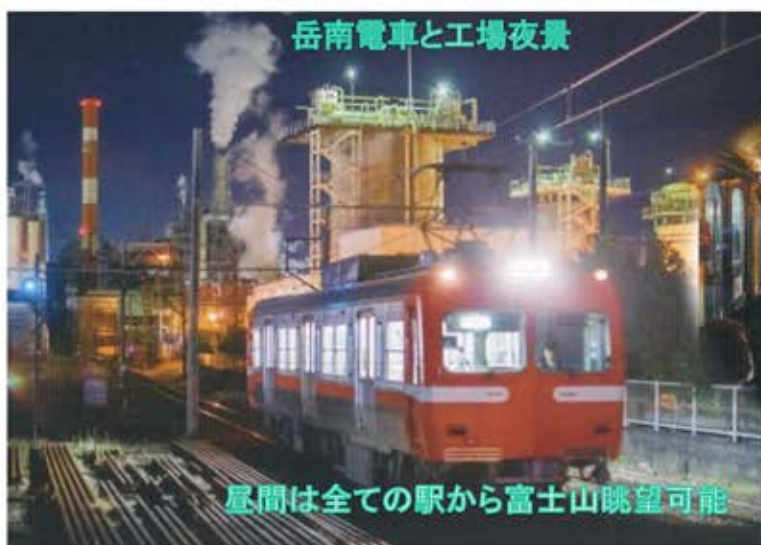
岳南電車と工場夜景