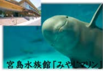
宮島水族館「みやしまリン」