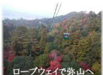
ロープウェイで弥山へ