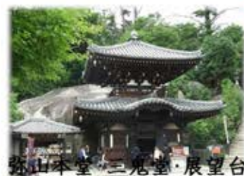
弥山本堂・三鬼堂・展望台