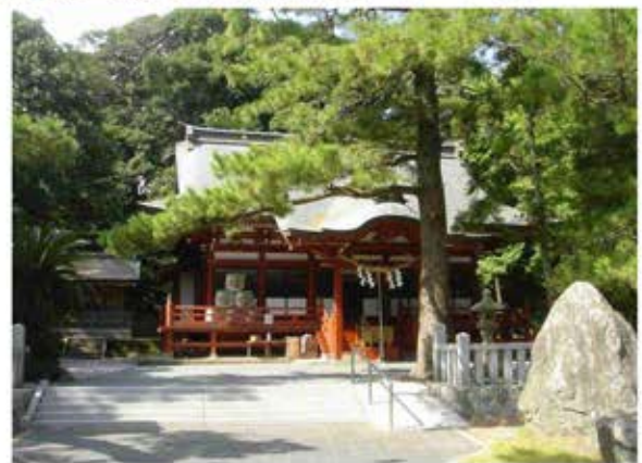
◎池宮神社（桜ヶ池） 0537-86-2309 静岡県御前崎市佐倉5162