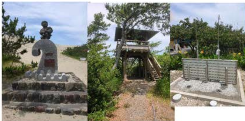
◎浜岡砂丘（左は波乗り小僧、右は展望台） 御前崎市池新田9124（外にシャワーあります）