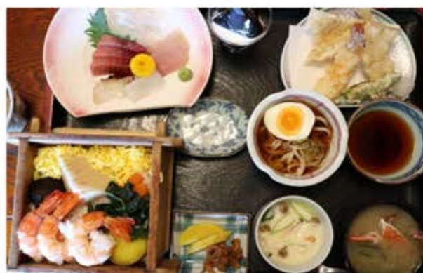
○光たく（魚介、和食） 0537-85-6123 17～22時定休水曜