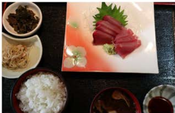
○夢屋（魚介、夢咲牛など） 0537-85-8230 18時半～21時定休日曜