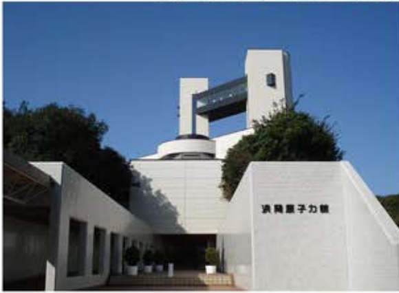
◎浜岡原子力館（現在臨時休館中） 0537-85-2424 静岡県御前崎市佐倉5561