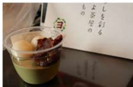
☆デザートが無いので【番外編】☆ ○まるよ茶屋（和スイーツなど） 0120-04-6089 10～16時半