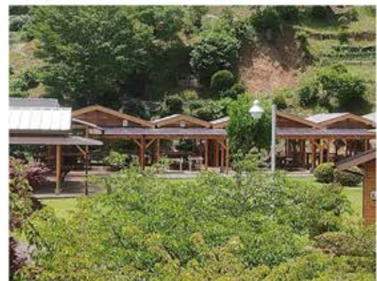
事前予約で手ぶらバーベキューできます 11時～20時 5名様以上（木曜定休）