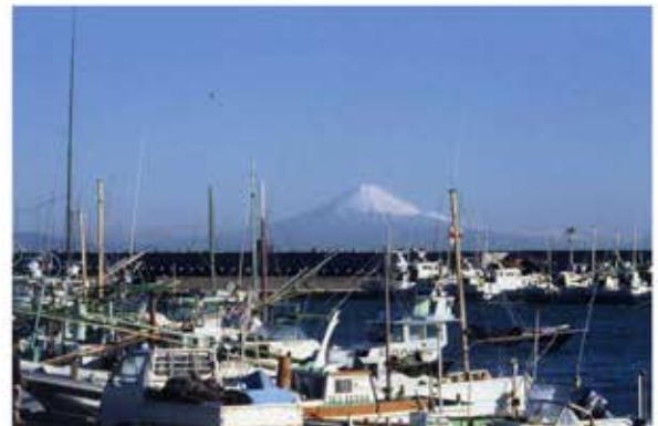
◎御前崎観光釣り船 0548-63-3111 御前崎市港6131