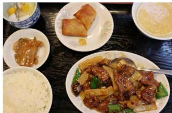
○シャオツー（中華料理） 0537-85-4252 17～21時定休月曜