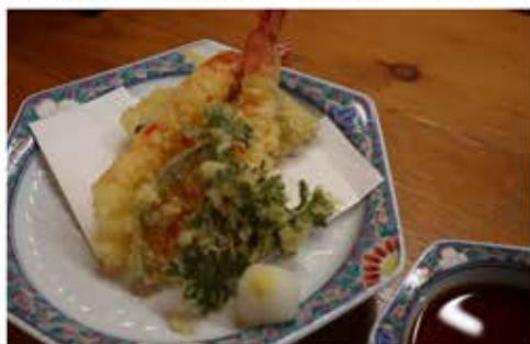
○浜一（魚介、和食） 0537-86-7388 17～20時定休月曜