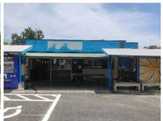
◎なごみ（水～土曜営業）（浜岡砂丘） 0537-85-2448 11時30分から14時 事前予約でバーベキューできます