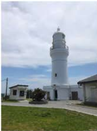
○御前崎灯台（参観寄付金大人200円） 0548-63-2550 御前崎市御前崎1581 参観9時から16時