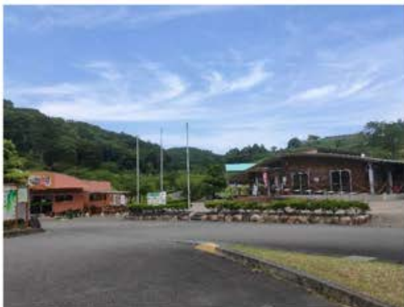
◎あらかわふる里公園（お土産、食堂あります） 0537-85-8230 御前崎市下朝比奈158-7