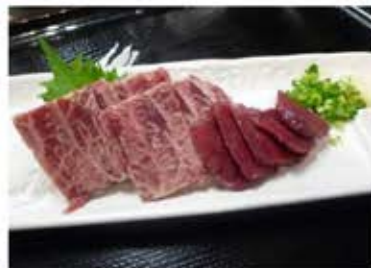
○なわのれん（居酒屋） 人気メニューだしまきと馬刺し 0537-86-8669 18～24時定休日曜