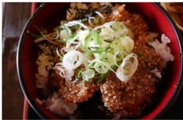
↑御前崎名物さわらめし